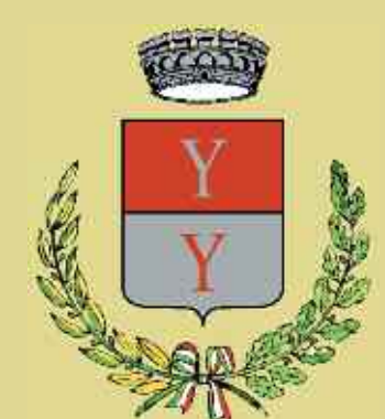
Stemma del Comune di Iseo