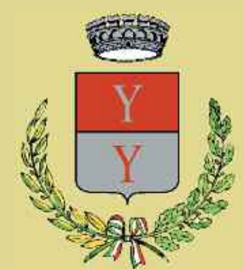
Stemma del Comune di Iseo